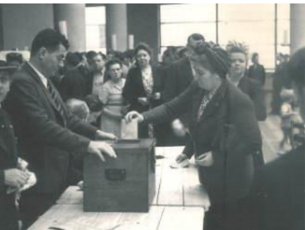
Photo4 1945 les Françaises votent pour la première fois