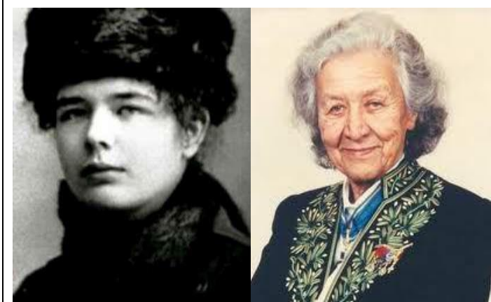
Photos 6 et 7 Marguerite Yourcenar jeune et en tenue d'académicienne