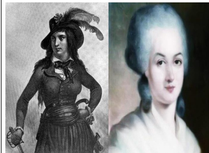
Photos 11 et 12 Théroigne de Méricourt et Olympe de Gouges