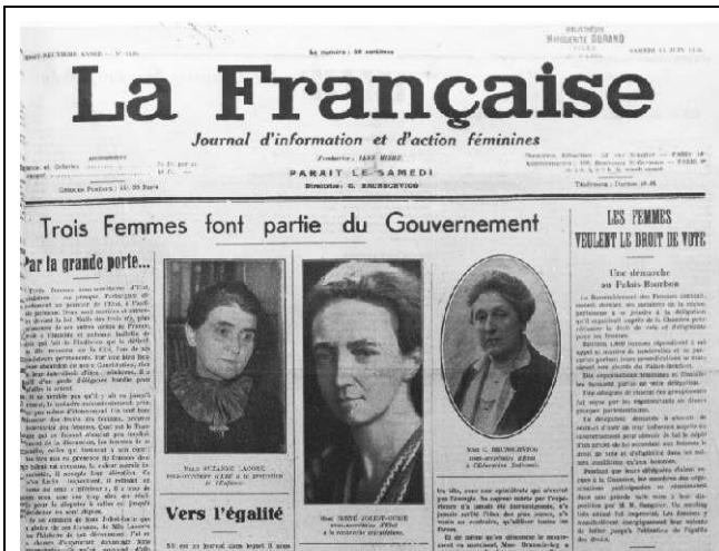
Photo 5 De gauche à droite Suzanne Lacore, Irène Jolito-Curie Cécile Brunschwig.