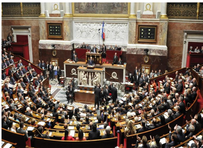
Photo 11 Le 27 juin 2014, le projet de loi pour l’égalité réelle entre les femmes et les hommes porté par Najat VALLAUD-BELKACEM a été adopté à l’Assemblée nationale à une large majorité. Tous les membres de la société doivent se mobiliser pour faire avancer cette cause.

Champ : France métropolitaine Source : EnquêteS emploi insee 2009 à 2011, traitement MEN-MESR DEPP