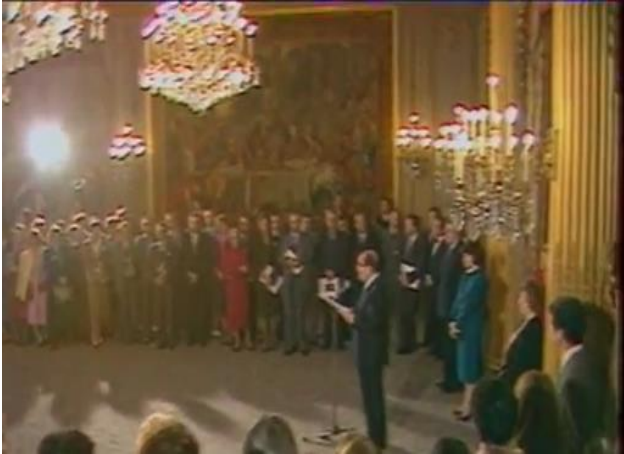
Photo 2 Discours de François Mitterrand qui a reçu 400 femmes au Palais de l'Élysée, ouvrières, employées, mère de famille.