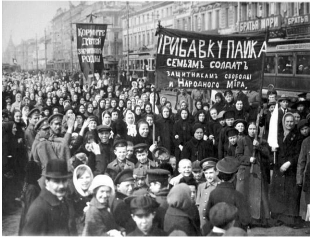
Photo 1 8 Mars 1910 à Copenhague