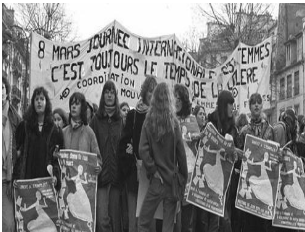
Photo 3 1982 les premières manifestations relatives au 8 mars en France ?